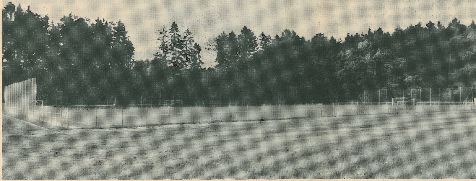
Sportplatz Andhausen in Berg wurde eingeweiht